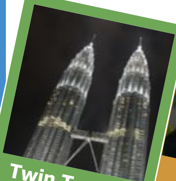
Twin Towers bei Nacht