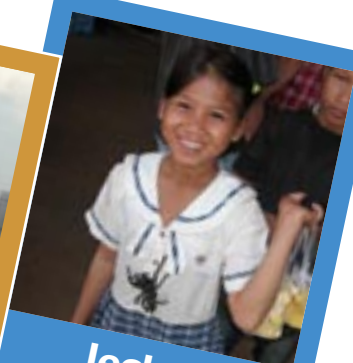
lecker Ess- Tarantel