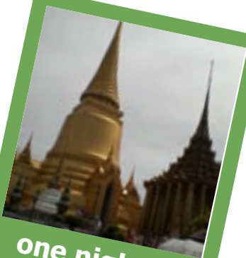
one night in Bangkok

Bis auf einige Paddler, die nicht genug Urlaub bekommen, dauerte die Reise 14-20 Tage. Das beste Gruppenangebot lieferte Thai Airways ab, so bot sich die Metropole Bangkok als ersten Zwischenstop an.