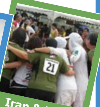
Iran & USA: Verbrüderung!